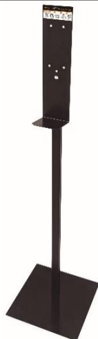
HGPT0020B Acabado negro mate