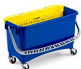
Cubo para recambio mojado