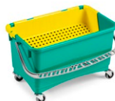
Jim con escurridor