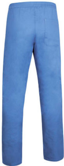
Vista parte trasera de la prenda