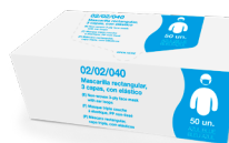
EJEMPLO DE PRESENTACIÓN