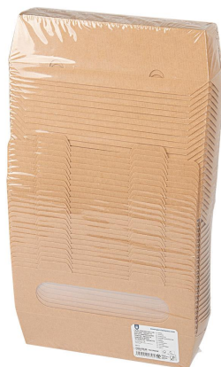
Imagen de paquete

Reglamento (CE) nº 2023/2006 de la Comisión, de 22 de diciembre de 2006, sobre buenas prácticas de fabricación de materiales y objetos destinados a entrar en contacto con alimentos.