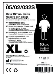
EJEMPLO DE PRESENTACIÓN

MATERIAL BOLSA: Polietileno 100% Virgen (0% reciclado) PESO: 7.08 gr *