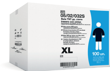
EJEMPLO DE PRESENTACIÓN