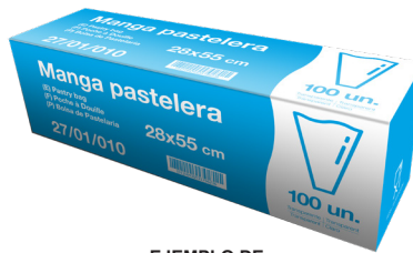
EJEMPLO DE PRESENTACIÓN