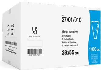
EJEMPLO DE PRESENTACIÓN